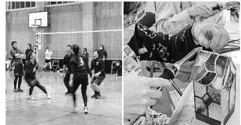
バレーボール大会 スタンドグラス制作講座